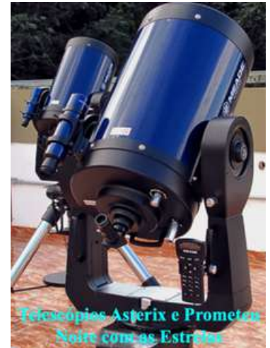
Telescópios Asterix e Prometeu Noite com as Estrelas

Com todas as transformações o Observatório tornou-se uma importante referência na difusão do conhecimento científico e um patrimônio cultural da região, uma das mais ricas e desenvolvidas do país. Sem dúvida, o evento "Noite com as Estrelas", iniciado em 2008, é o mais popular aqui desenvolvido atraindo milhares de visitantes por ano que se deliciam com as observações do céu e com verdadeiras e descontraídas aulas de Astronomia ao ar livre. Em sua área de 450 mil metros quadrados de mata nativa abriga e protege várias espécies de plantas e de animais silvestres, algumas delas já estudadas em trabalhos acadêmicos diversos.