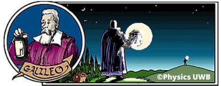
Ilustração do experimento de Galileu para cálculo da velocidade da luz

Deve-se acelerar a roda até que atinja uma velocidade de forma que a luz entre em uma fenda e saia em uma seguinte. Aí está o segredo, se tivermos a velocidade que a roda está girando, podemos fazer uma relação entre o tempo em que a roda leva para fazer uma rotação e o intervalo de tempo no vai e vem da luz e dessa forma obter sua velocidade.