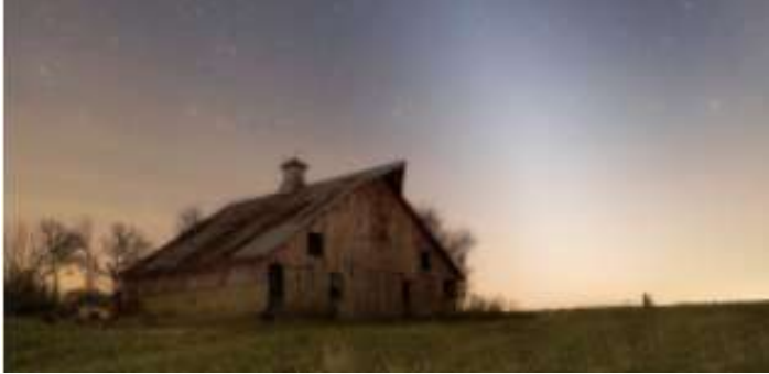
©Zodiacal Light and Mars. Créditos: APOD/NASA, Joshua Rhoades.

Ao escutar sobre o aparecimento de luzes diferentes no céu muitas vezes as pessoas associam a ETs, "aparições" ou até mesmo a algo místico. Isso acontece porque muitas vezes não entendemos o que estamos olhando, mas quase sempre há uma explicação mais simples para esses eventos. Uma dessas "luzes" que aparecem no céu é a Luz Zodiacal. Já ouviu falar dela?