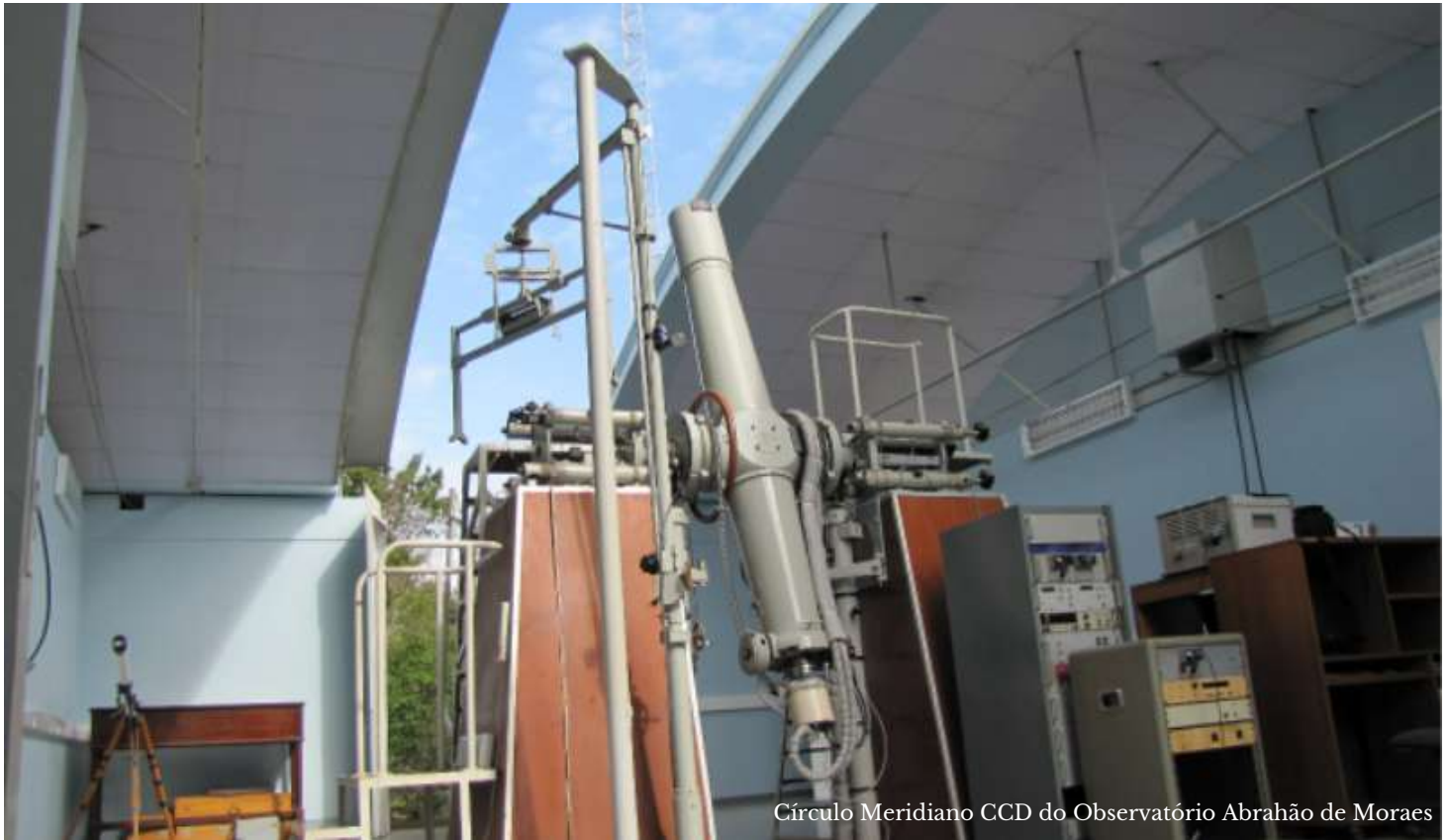
Círculo Meridiano CCD do Observatório Abrahão de Moraes