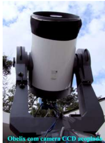
Obelix com camera CCD acoplada

de 41 cm de abertura usado para observações de satélites e restos de satélites artificiais em colaboração com o Observatório de Xangai; e dois telescópios MEADE idênticos de 31 cm de abertura usados para observações noturnas com o público no evento "Noite com as Estrelas".